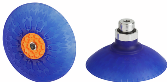
SAXM 80 ED-85 G3/8-AG