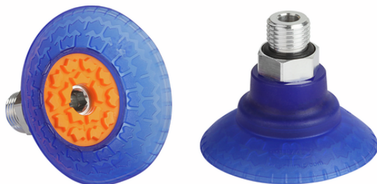
SAXM 50 ED-85 G1/4-AG

La ventouse cloche SAXM (pièce en élastomère + élément de fixation) est livrée montée. Vous pouvez également commander les différentes pièces détachées de la ventouse :