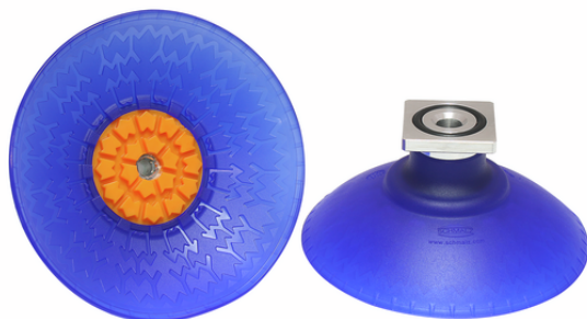
SAXM 100 ED-85 RA