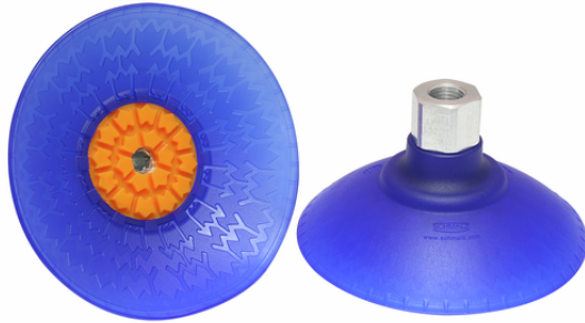
SAXM 100 ED-85 G1/4-IG