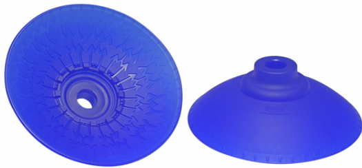
SAXM 115 ED-85 SC065