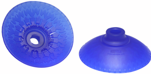
SAXM 80 ED-85 SC055