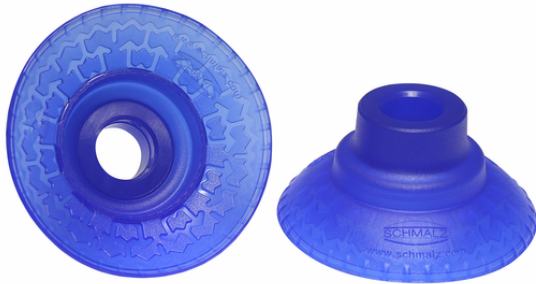
SAXM 50 ED-85 SC055