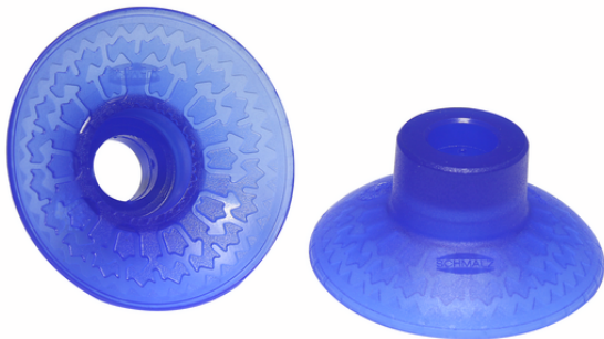
SAXM 40 ED-85 SC045