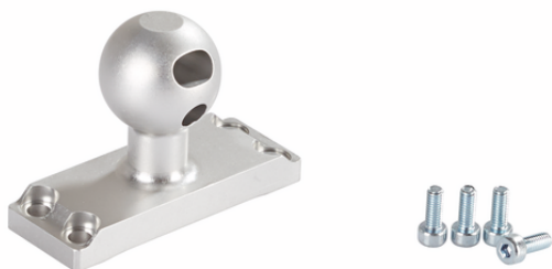
HTS-A5 SGM-HP 30/40 OP