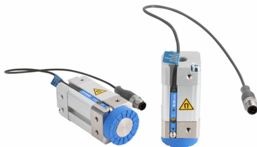
SGM-HD-S 30 G1/8-IG PNP