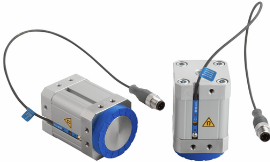
SGM-HD-S 50 G1/4-IG PNP