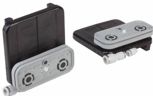
VCBL-S1 120x50x32.7 TV-S