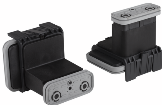
VCBL-K1 120x50x125 L

Блочная присоска VCBL-K1 поставляется в сборе. Изделие состоит из: