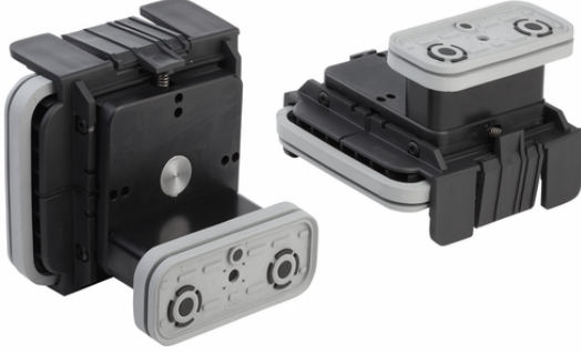
VCBL-K1 120x50x85 L

VCBL-K1 vakum bloęu monte edilmiř olarak teslim edilir. Ürün řunlardan oluřur: