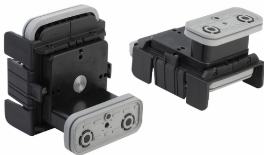
VCBL-K1 120x50x85 Q