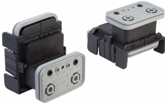
VCBL-K1 125x75x85 Q