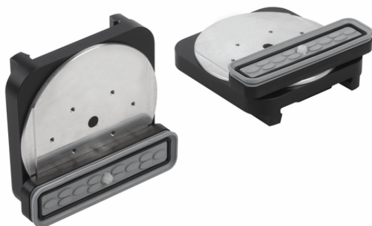
VCBL-S1 130x30x32.7 D-360 TV