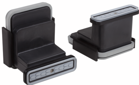
VCBL-K2 130x30x100 Q

Блочная присоска VCBL-K2 поставляется в собранном виде. В комплект поставки продукта входят: