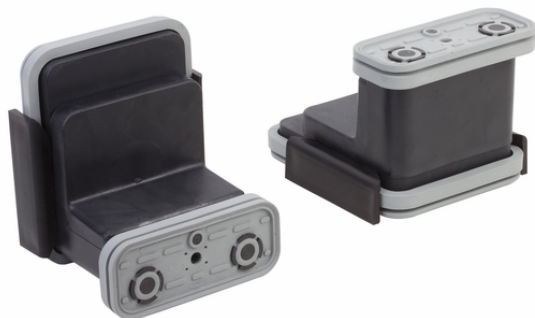
VCBL-K2 120x50x100 Q