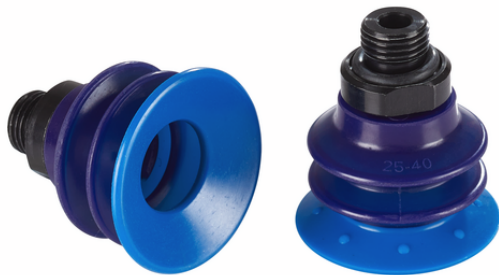
SDC2 40 PU 30/60 G1/4-AG

Der Sauggreifer SDC2, verfügbar in verschiedenen Durchmessern, wird mit montiertem Anschlussnippel geliefert.