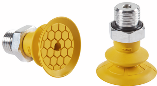
SFB1 30 NBR-ESD-55 G1/4-AG

Der Sauggreifer SFF / SFB1 (Elastomerteil + Anschlussnippel) wird montiert geliefert.