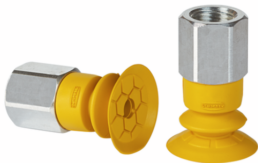
SFB1 20 NBR-ESD-55 G1/8-IG

Присоска SFF / SFB1 (эластомерная часть + соединительный ниппель) поставляется в собранном виде.