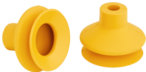
FGA 25 NBR-ESD-55 N062