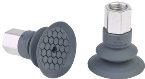
SFB1 40 EPDM-45 G1/4-IG

La ventosa SFF / SFB1 (pieza de elastómero + boquilla de conexión) se suministra montada.