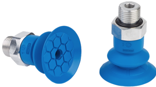
SFB1 25 HT1-60 G1/8-AG

La ventosa SFF / SFB1 (parte in elastomero + nipplo di collegamento) viene fornita montata.