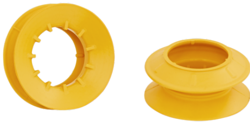
FLSA 40 NBR-ESD-55