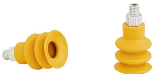
FSG 20 NBR-ESD-55 M5-AG

La ventosa FSG (pieza elastomérica + boquilla de conexión) se suministra desmontada (se monta a partir de un diámetro de 32 mm). El suministro se compone de: