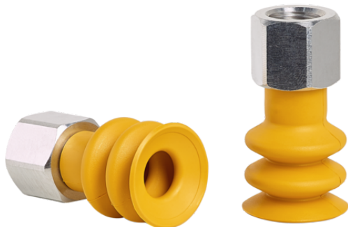
FSG 20 NBR-ESD-55 G1/8-IG