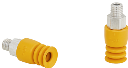
FSG 9 NBR-ESD-55 M5-AG

La ventosa FSG (pieza elastomérica + boquilla de conexión) se suministra desmontada (se monta a partir de un diámetro de 32 mm). El suministro se compone de: