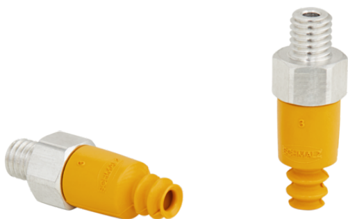
FSG 3 NBR-ESD-55 M5-AG

La ventosa FSG (parte in elastomero + nipplo di connessione) viene fornita non montata (montata a partire da un diametro di 32 mm). La fornitura è costituita da: