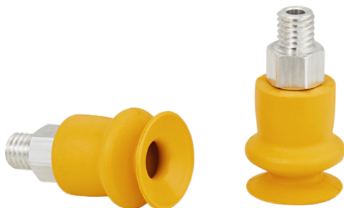
FSGA 11 NBR-ESD-55 M5-AG

La ventosa FSGA (pieza elastomérica + boquilla de conexión) se suministra desmontada (a partir del diámetro 33 mm montada). El suministro se compone de: