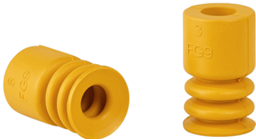
FG 9 NBR-ESD-55 N062