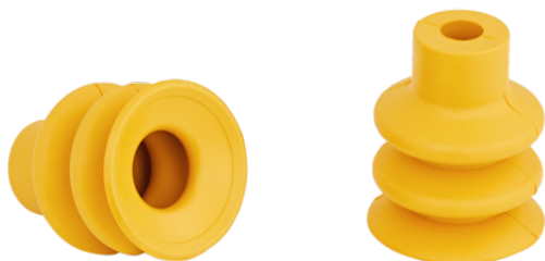
FG 20 NBR-ESD-55 N062