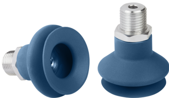
FSGA 33 SI-MD-55 G1/4-AG