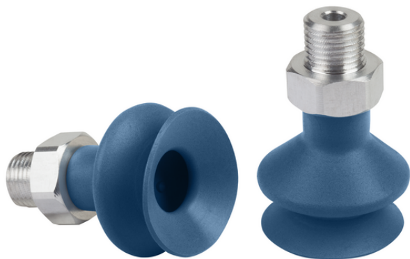
FSGA 25 SI-MD-55 G1/8-AG