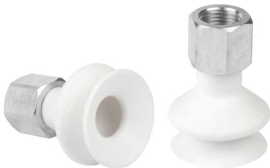
FSGA 25 SI-HD-65 G1/8-IG