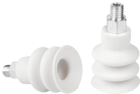
FSG 18 SI-HD-65 M5-AG

La ventosa FSG (pieza elastomérica + boquilla de conexión) se suministra desmontada (se monta a partir de un diámetro de 32 mm). El suministro se compone de: