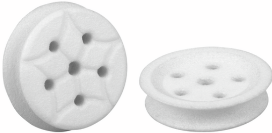
SPI 30 PA SPB2-30