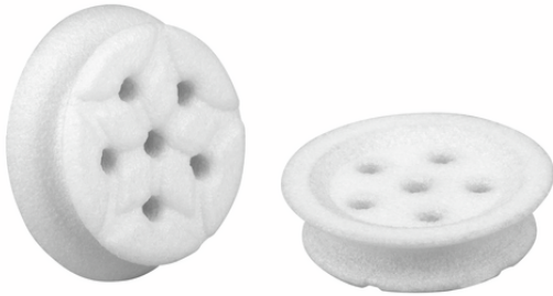
SPI 20 PA SPB2-20