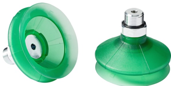
SPB1 80 ED-65 G1/2-AG