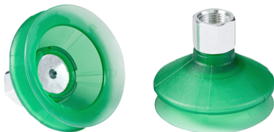
SPB1 80 ED-65 G1/2-IG