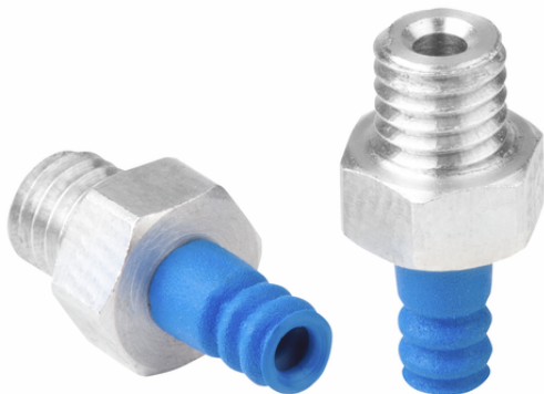
FSG 3 HT1-60 M5-AG