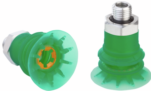
SPB2f 30 SI-55 G1/8-AG

La ventosa SPB2f (parte in elastomero + elemento di collegamento) viene fornita montata. Il prodotto è costituito da: