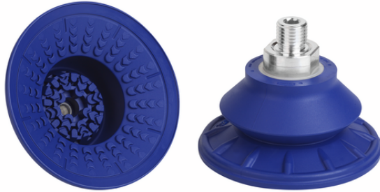
SAB 80 NBR-60 M16-AG

La ventosa SAB disponible en diversos diámetros se suministra con boquilla de conexión vulcanizada en la pieza elastomérica.