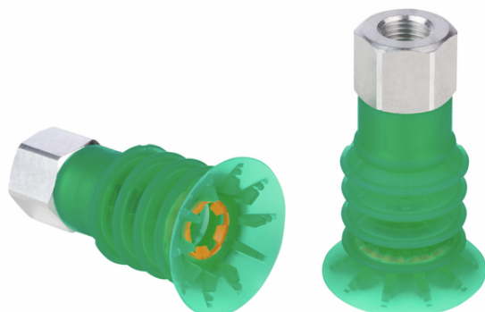
SPB4f 40 SI-55 G1/4-IG