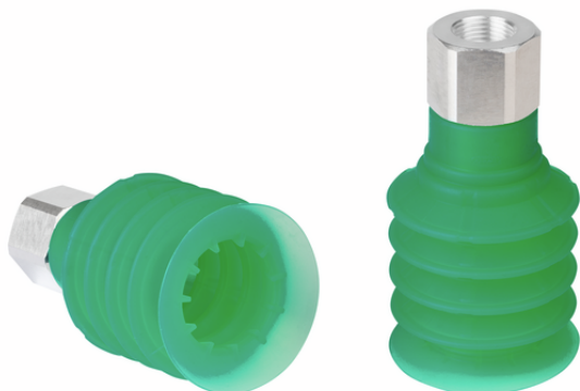
SPB4 50 SI-55 G3/8-IG