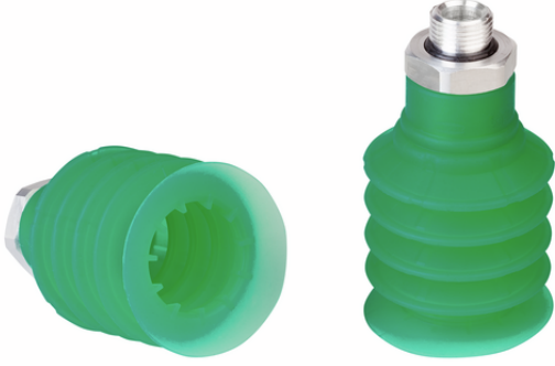
SPB4 50 SI-55 G1/2-AG

Vantuz SPB4 (elastomer parça + bağlantı elemanı) monte edilmiş olarak teslim edilir. Montaj şunlardan oluşur: