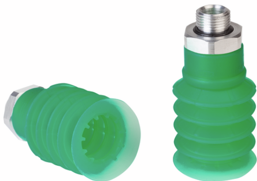
SPB4 40 SI-55 G1/2-AG