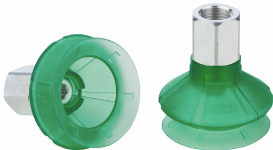
SPB1 30 ED-65 G1/8-IG