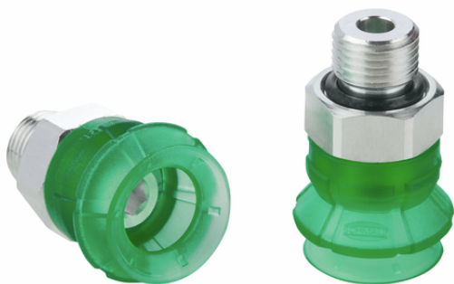
SPB1 10 ED-65 M5-AG